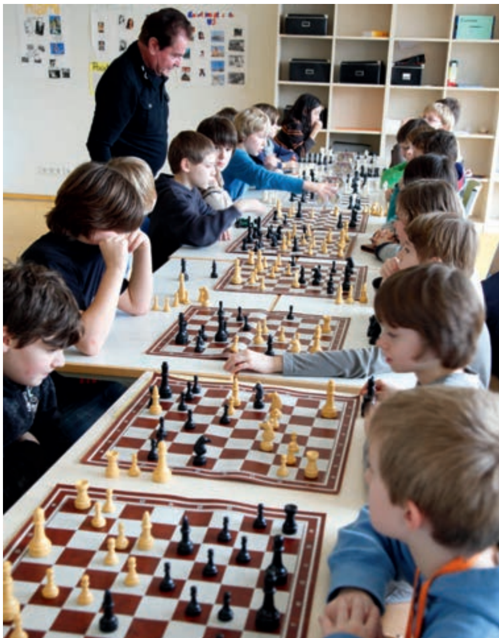
Ein Thema der Schulkonferenz: Die Einrichtung von Ganztags- und Betreuungsangeboten